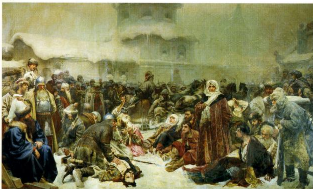
К. Лебедев. Уничтожение новгородского вече

городцы. — К московскому князю примкнуть надо!