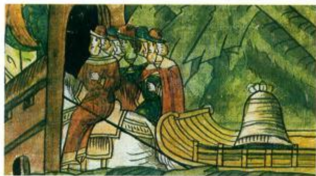
Вывоз вечевого колокола из Новгорода

сводят: не видать ли вдалеке повозки с греческой царевной? Целых два года вдовел Иван III, не желал после смерти Марии Борисовны никого себе в жены брать. И вдруг приехали в Москву важные послы от самого папы римского, предло-