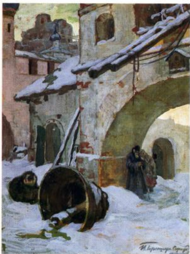
И. Горюшкин-Сорокопудов Упавший колокол