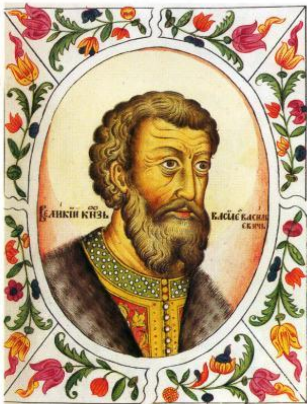
❖ Великий князь Василий Темный

ли в церкви молодым обменяться кольцами, и надел Иван на тонкий детский пальчик Марии тяжелое золотое кольцо. С обратной стороны на нем до поры до времени прилеплен комочек воска. Чтобы не соскользнуло с пальца венчальное кольцо, не затерялось.