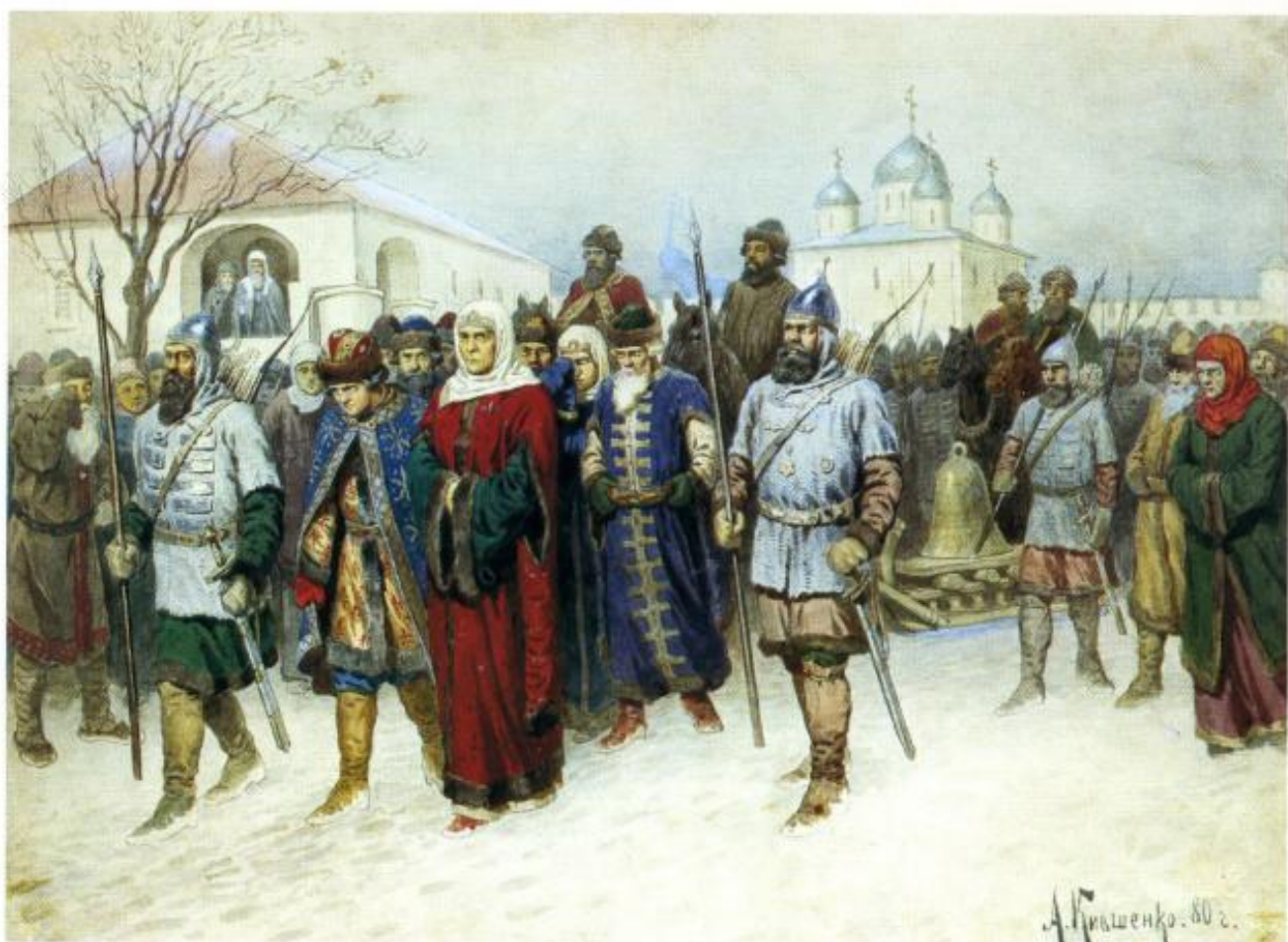
А. Кившенко. Присоединение Великого Новгорода — высылка в Москву знатных и именитых новгородцев

после присоединения Твери и Вятки, Иван Васильевич начал подписывать указы новым титулом — «Божьей милостью государь всея Руси великий князь Владимирского и Московского, Новгородского и Псковского, и Тверского, и Югорского, и Пермского, и Болгарского, и иных земель».