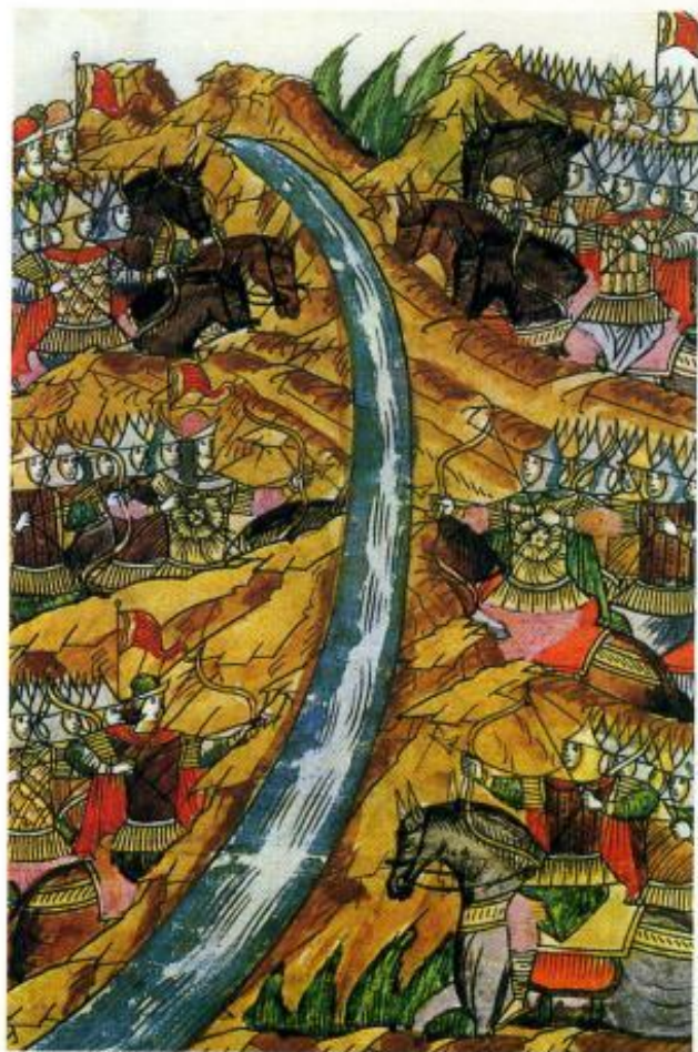
✦ Стояние на реке Угре

Ахмат собрал большую рать, уговорил литовского князя вместе идти на Русь. Скачет казанский хан во главе войска и все представляет, как он дерзкому московскому князю кривой саблей голову отрубил. А потом потребует с русских огромную дань: золото, серебро, меха, мед. Подъехали татары к притоку Оки — Угре. Угра — погранич-